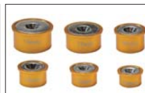
ボルト用マグネットキャップ (10mm・12mm・13mm・14mm・17mm・19mm各2個)