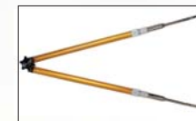
バランスゲージ本体(650g)