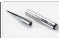
ニードルジョイント(ボールジョイント変更用)・延長ジョイント