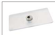
マグネット付プレート3枚