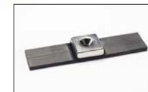
マグネットベルト2枚